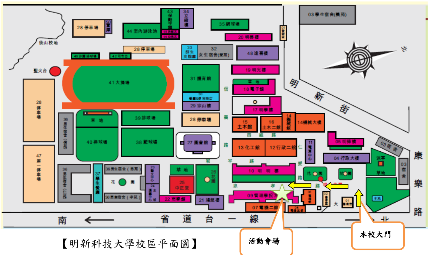
【明新科技大學校區平面圖】

(四) 當日接駁車資訊:研習當天(107年6月27日)將於 高鐵新竹站 提供接駁車接駁至本校服務，當日早上接駁車 8:30 發車，回程為 17:00 發車，欲搭乘接駁車之參與老師請於報名系統中事先勾選，以利人數統計。